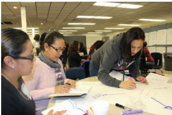
Three CSD Parents work on group project during YOU: Parent Workshop

More than 300 parents in the Cartwright School District received the opportunity to attend free interactive workshops presented by YOU: Your Child's First Teacher during the final week of January. The workshops provided parents with free tools and resources to assist with their child's success in school and in life. Parents learned how to get resources for themselves and their children as well as see how to get their child on the path to college. The interactive workshops also allowed parents to share ideas with others and gave them the opportunity to ask questions. This was the first time YOU: Your Child's First Teacher program was presented in Arizona. Parents were excited to participate in the workshop. "The workshop really helped us think more about our children and their environment. They helped us understand the importance of a child's physical and emotional well being and how that relates to school and what we can do to help motivate them," one Estrella Middle School parent said. All attendees received a free book set at the end of the workshop. Each book covers the different stages of a child's life; the early years, elementary and middle school and high school and beyond.